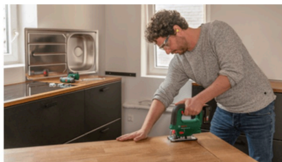
Taglio di piani di lavoro della cucina