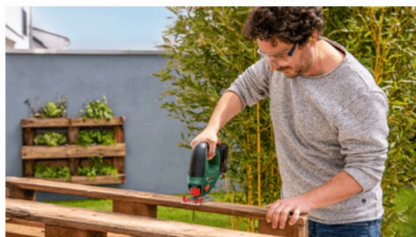
Creazione di progetti personalizzati con pallet