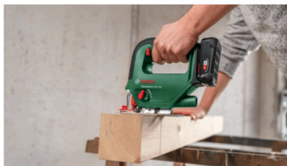
Concepito per tagliare fino a 100 mm di profondità nel legno