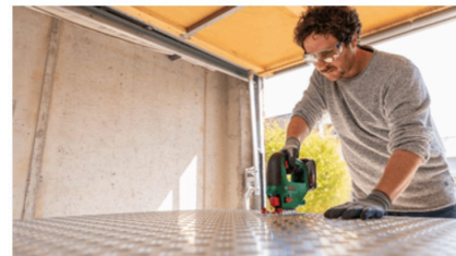
Tagli rapidi e regolari nel metallo