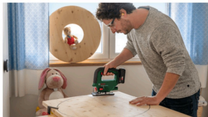
Lavoro ben controllato, per eseguire tagli curvi con precisione