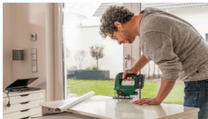
Taglio di superfici lucidate a specchio, con guida di protezione per superfici delicate