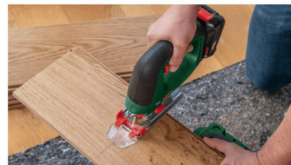
CutControl per seguire con precisione la linea di taglio