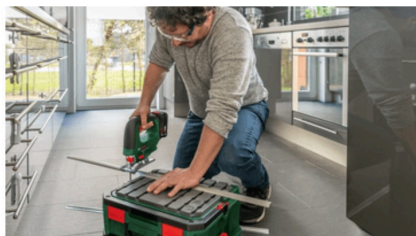
Taglio dei battiscopa