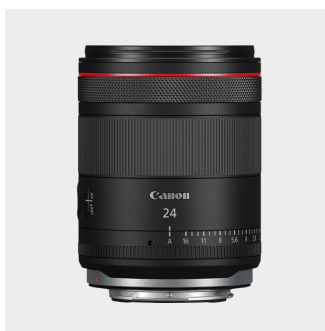
RF 24mm F1.4 L VCM