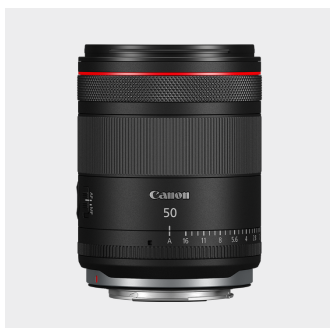
RF 50mm F1.4 L VCM