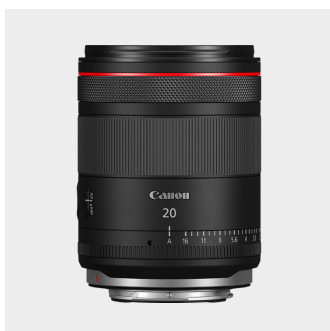
RF 20mm F1.4 L VCM

Adatta l'obiettivo al tuo stile di ripresa grazie alla ghiera di controllo personalizzabile e al pulsante per le funzioni. La ghiera dell'iride 4 offre un controllo fluido del diaframma nei video, così come negli scatti fotografici con alcune fotocamere compatibili.