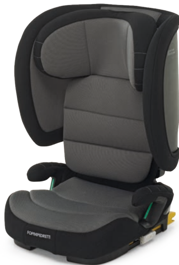
BLACK cod. 9700411301

Chiusura compatta ideale per i viaggi Compact fold, ideal for travel Cierre compacto, ideal para viajar