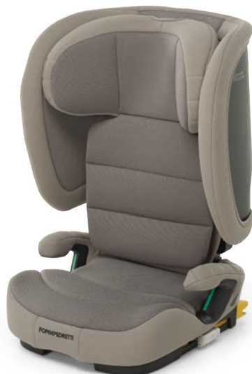
DESERT cod. 9700411303