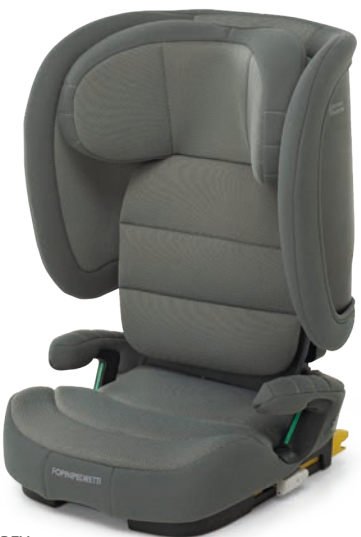
GREY cod. 9700411302