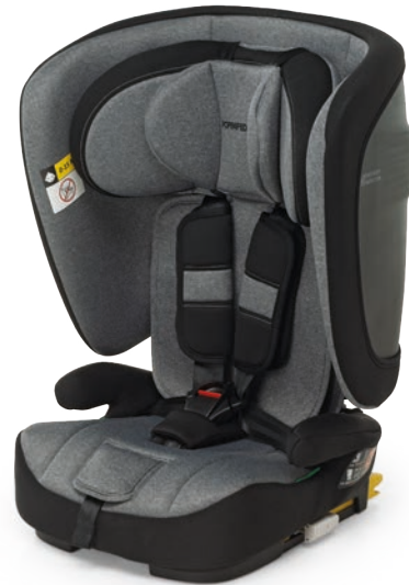
CARBON cod. 9700411201

Test di impatto laterale "Safe Body Protection" "Safe Body Protection" side impact test Prueba de impacto lateral Safe Body Protection