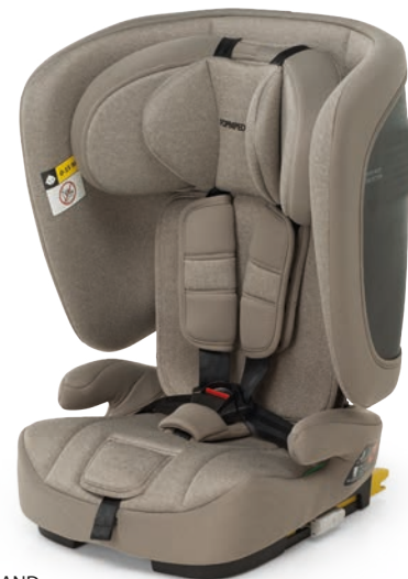
SAND cod. 9700411202

Chiusura compatta ideale per i viaggi Compact fold, ideal for travel Cierre compacto, ideal para viajar