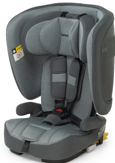
SILVER cod. 9700411203