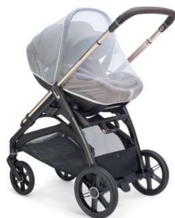
Zanzariera per car seat Infant Mosquito net for Infant car seat

Scopri tutte le varianti a pagina 202 Discover the colour range on page 202