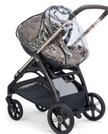
Parapioggia per car seat Infant Rain Cover for Infant car seat