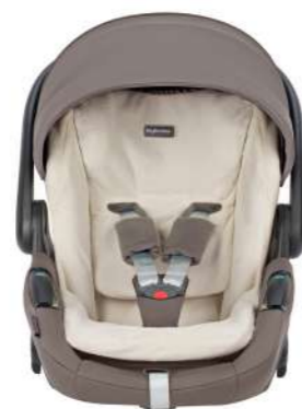
Summer Cover per seggiolino auto Darwin Infant Recline Evo Summer Cover for Darwin Infant Recline car seat Evo