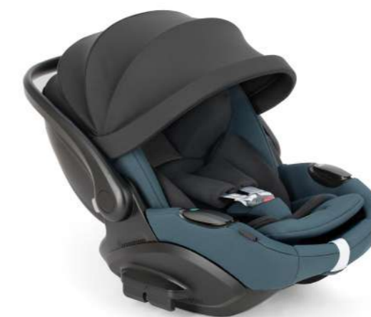
Himalaya Blue AV72TOHMB