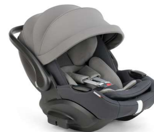
Garage Grey AV52TOGRG