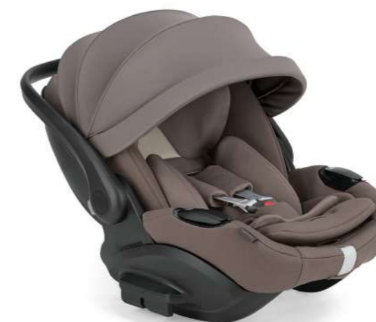
Essence Mokka AV62TOESM