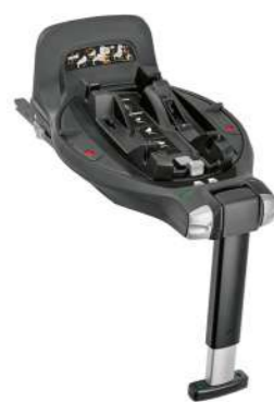
Base Darwin 360° i-Size per seggiolini auto Darwin Infant, Darwin Infant Recline Evo e Darwin Next Stage i-Size (ECE R129/04) Darwin 360° i-Size car base for Darwin Infant, Darwin Infant Recline Evo and Darwin Next Stage i-Size (ECE R129/04)