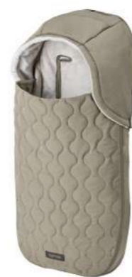
Newborn Footmuff per culla e seggiolini auto Newborn Footmuff for carrycot and car seat

Scopri tutte le varianti a pagina 202 Discover the colour range on page 202