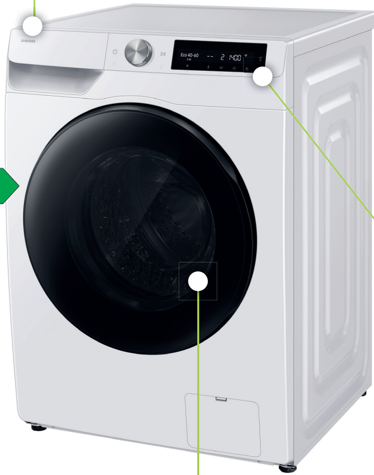
Display AI Control®